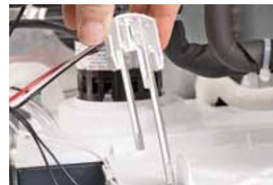
Sensor de agua basado en la conductividad eléctrica