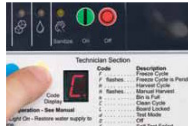
Comunica información operativa

Utiliza una tecnología de ultrasonido probada en campo para mantener el nivel seleccionado de hielo, con la exclusiva función de programación de niveles de hielo para hasta 7 días. Los clientes obtienen el hielo que desean al mismo tiempo que los operadores ahorran agua y electricidad.