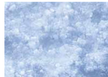
Hielo en escamas (Flake Ice)

Ventajas: las escamas de hielo seco de Scotsman enfrían con mayor rapidez que otros tipos de hielo. Esta capacidad de enfriamiento se combina con muy bajos costos de producción. Las escamas se amoldan a cualquier forma para el uso práctico en arreglos con hielo y bares de ensaladas.