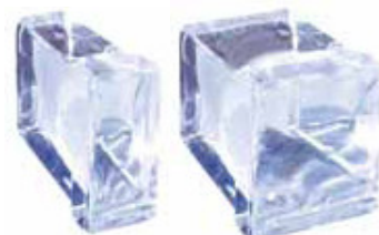
Hielo en cubitos pequeños

Ventajas: disponibles en tamaño pequeño y mediano para ajustarse a sus necesidades. Para un desplazamiento óptimo del líquido, elija el cubo pequeño.