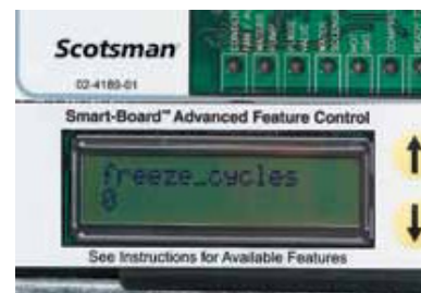
Funciones de diagnóstico en pantalla o transmitidas de forma remota